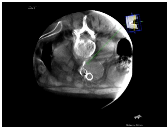
Figura 3. Embolização de endoleak tipo II por via translombar. Cálculo da trajetória por tomografia computadorizada tridimensional em tempo real. A trajetória ideal da agulha é determinada pelo cirurgião vascular marcando o endoleak como alvo e tendo o cuidado de evitar estruturas anatômicas vitais.

Não existe consenso na literatura sobre qual dessas duas opções de acesso (transarterial ou translombar) apresenta maior taxa de sucesso. A maioria dos estudos demonstra resultados superiores da abordagem translombar, com menores taxas de recorrência e menos complicações 1,2 . Entretanto, como regra geral, o método translombar é utilizado como segunda linha de tratamento, após a falha da abordagem transarterial, criando um viés na análise dos resultados 1 . Por outro lado, Stavropoulos et al. 16 encontraram, em seu estudo, resultados semelhantes na comparação entre essas duas abordagens, fato que também foi observado na casuística do presente estudo. Da mesma forma, analisando os diferentes materiais utilizados para embolização, não houve qualquer diferença estatisticamente significativa de superioridade entre os materiais, fato que também foi evidenciado por outros estudos na literatura 14 .