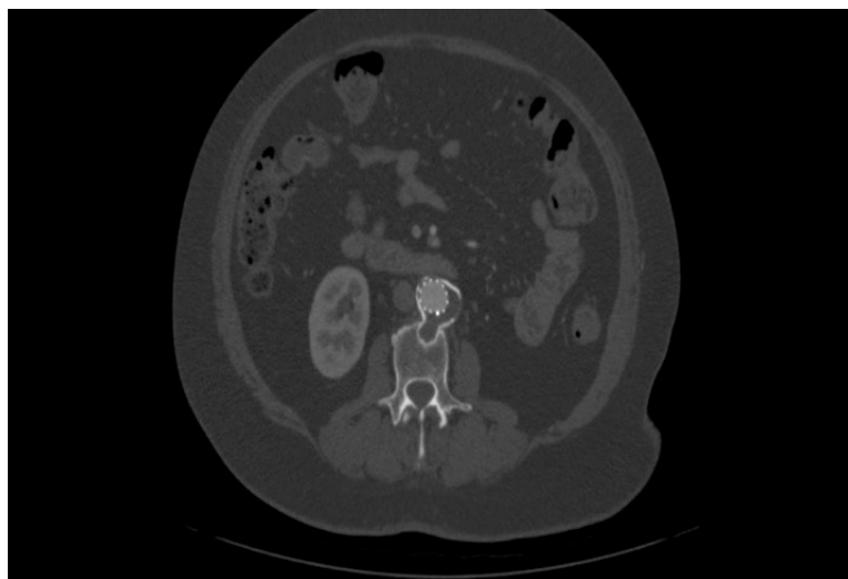
Figura 3. Corte axial de angiotomografia pós-operatória mostrando a endoprótese no interior do saco aneurismático, com exclusão do mesmo, sem evidência de endoleak.