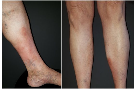
Figura 2. Em julho de 2016, observou-se melhora do quadro com regressão do eritema e infiltração na porção anterolateral do terço distal do membro inferior esquerdo. A paciente referiu melhora da dor.

Em agosto de 2017, mesmo sem o uso das meias compressivas e após a retirada do clobetasol e da pentoxifilina, a paciente apresentava remissão quase total da forma aguda da LDE, usando somente oxandrolona 10 mg, duas vezes ao dia. Em janeiro de 2018, encontrava-se bem e suspendeu o tratamento por motivos financeiros. Desde então, permanece estável, sem nenhum tratamento para LDE (Figura 3).