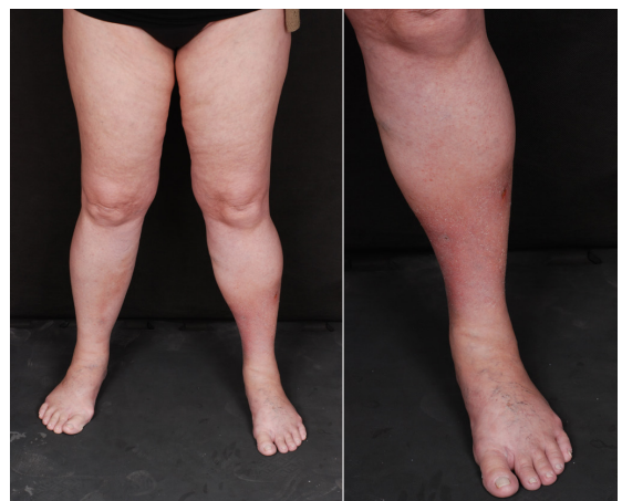
Figura 1. Eritema, edema, infiltração e áreas de fibrose predominando na parte distal do membro inferior esquerdo.

O duplex scan dos MMII, realizado em maio de 2015, mostrava safenectomia magna parcial bilateral, incompetência segmentar da veia safena parva bilateralmente, ramos tributários e não tributários insuficientes, perfurantes insuficientes e linfedema, além de sistema venoso profundo pérvio e competente. O exame histopatológico da lesão apresentava derme com discreto infiltrado inflamatório linfo-histiocitário perivascular e intersticial e edema mixoide. Na hipoderme, havia neovascularização septal e raros histiócitos espumosos. Diante da história e do exame físico, associados aos resultados laboratoriais,