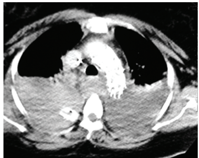
Figura 3 - Tomografia computadorizada de controle com a correção da lesão com stent

Na literatura, existem relatos de indicações não usuais de terapêutica endovascular em afecções da porção torácica descendente da aorta. Shimono et al. relataram o tratamento endovascular de um único caso de dissecção aguda de aorta ascendente com fenda intimal na aorta descendente, onde, após a colocação da endoprótese, ocluindo o orifício intimal na porção descendente, obtiveram sucesso no tratamento, constatado através da trombose da falsa luz, tanto na aorta ascendente quanto na aorta descendente, com satisfatória evolução clínica do paciente 4 .