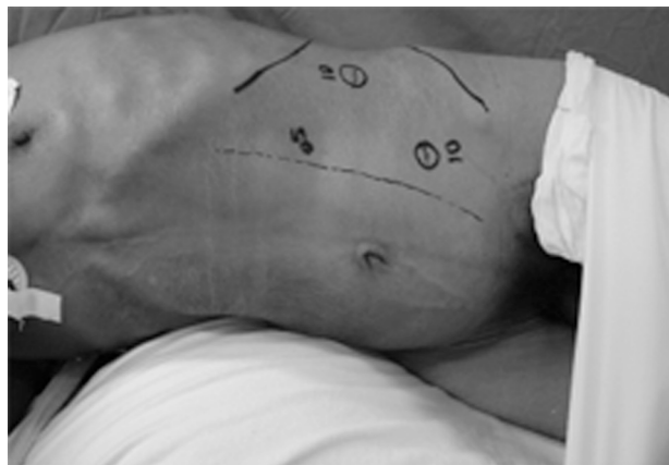
Figura 2 - Demarcação dos portais para acesso à cavidade retroperitoneal (pode-se, opcionalmente, como descrito no texto, introduzir um quarto portal para o afastador)

Com a criação de um espaço na cavidade retroperitoneal, através da insuflação do gás, e com o auxílio da câmara que permite uma visualização direta e mais segura, introduzem-se o segundo e terceiro portais. O segundo portal de 10 mm é colocado cerca de 2 a 4 cm lateralmente à borda do reto abdominal, distalmente ao portal da câmara. O terceiro portal, que tem 5 mm, é colocado na mesma referência que o segundo, porém em posição proximal. Esses dois últimos portais são utilizados como instrumentos de trabalho (dissecção e apreensão). Com freqüência, necessita-se de um quarto portal para colocar um terceiro instrumento de trabalho (afastador de fígado), que irá rebater superiormente o psoas, já que este freqüentemente cobre a cadeia simpática, dificultando a visualização.