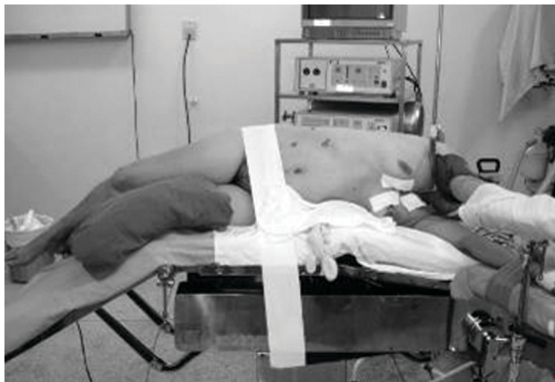
Figura 1 - Posicionamento do paciente na mesa cirúrgica

as outras são de aproximadamente 1-1,5 cm, o suficiente para introduzir o trocarte. O local dessas incisões está representado na Figura 2. A primeira incisão de 2-3 cm localiza-se na linha axilar anterior, a meia distância entre a borda costal e a crista ilíaca, por onde se introduz a câmara de 10 mm. Através dessa primeira entrada, faz-se inicialmente uma dissecação romba que irá progredir através dos planos músculo-aponeuróticos até chegar o peritônio. Nesse momento, faz-se dissecação com o dedo, rebatendo o peritônio medialmente até chegar na gordura retroperitoneal e, em seguida, insere-se o trocarte de 10 mm de modo a criar espaço, afastando-se o peritônio medialmente. Então, suturam-se as duas extremidades da incisão na fáscia para impedir o vazamento de gás carbônico que será insuflado com pressão 12-14 mmHg.